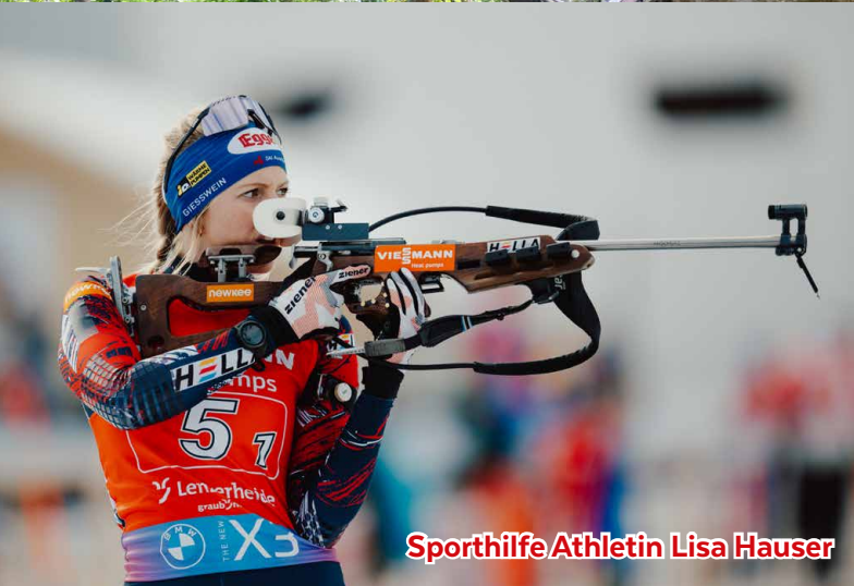
Sporthilfe Athletin Lisa Hauser